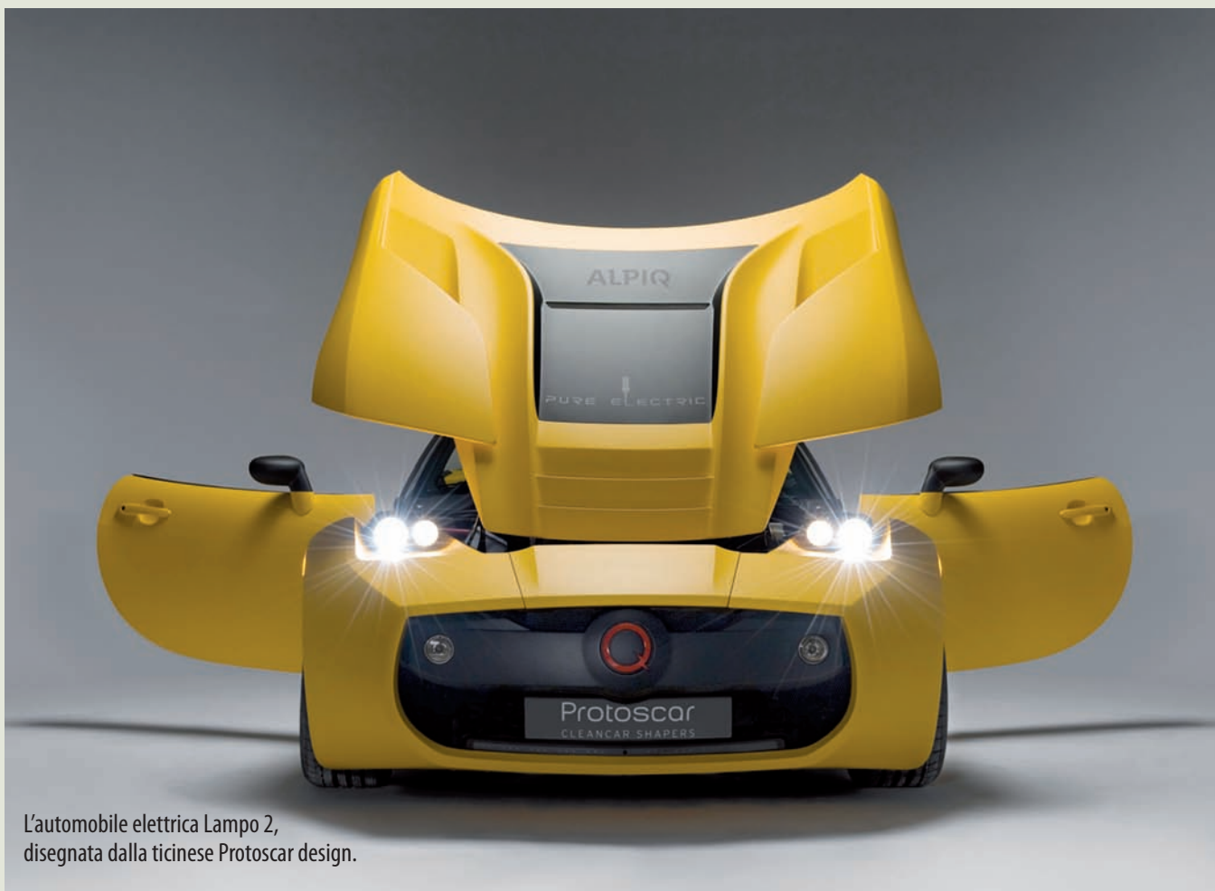
L'automobile elettrica Lampo 2, disegnata dalla ticinese Protoscar design.

Come preparare invece che subire la fine dell'energia fossile? Il mondo della ricerca è in fermento per trovare tecnologie e utilizzi sempre più efficienti di fonti d'energia rinnovabili. E il Ticino non rimane indietro.