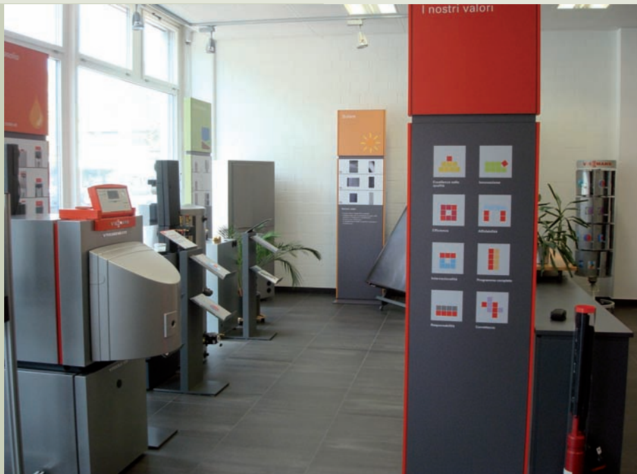
La sede Viessmann al Centro Carvina di Taverne con esposti i vari modelli di caldaie, pompe di calore, impianti per biogas e collettori solari.