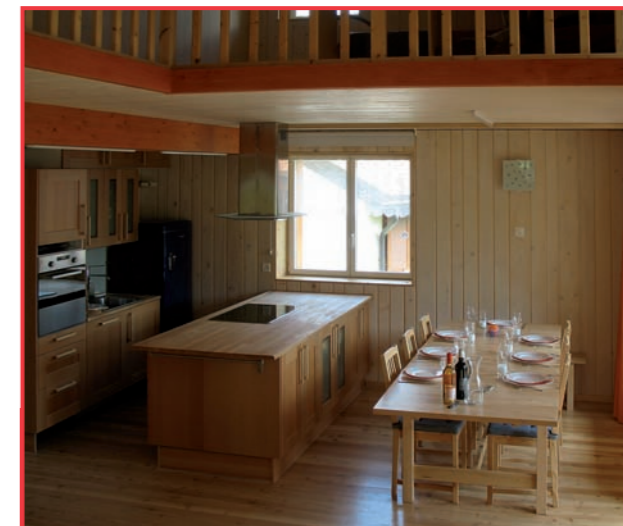
Cette construction en bois a utilisé 2 minutes de la croissance forestière suisse.

La toiture est isolée de la même manière que les façades, et sur l'extérieur, les panneaux en fibres de bois de 100 mm sont recouverts d'un lé d'étanchéité et d'une couverture de tuile de terre cuite «Joran» et de tuiles de verre. La ferblanterie est en acier inoxydable afin de permettre la récupération de l'eau de pluie. Cette eau est ensuite utilisée pour la machine à laver le linge, les WC et l'arrosage du jardin.