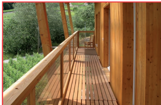
Une construction en harmonie avec la nature

concept bioclimatique, qui revient à analyser et prendre en compte le terrain, l'environnement, le soleil et les vents dominants ainsi que concevoir un immeuble compact, orienté au sud, c'est finalement retrouver l'art de bâtir en associant au mieux l'homme et son environnement. Il ne s'agit pas d'une nouveauté, mais simplement d'appliquer des règles qui ne sont que l'expression d'un bon sens trop souvent perdu lorsqu'il s'agit de répondre à des impératifs tels que construire toujours plus vite et au meilleur coût possible.»