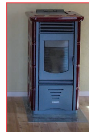
A gauche: Fourneau à pellets En bas: Installation photovoltaïque sur le toit du bâtiment

Des choix énergétiques faisant appel aux énergies renouvelables ont bien entendu été privilégiés. L'installation électrique intérieure est disposée en étoile, complétée par des câbles blindés dans la partie nuit avec Bio-Switch. L'énergie électrique est apportée par 10 panneaux photovoltaïques d'une puissance de 1,5 kWp. Cette électricité est injectée dans le réseau communal. Le chauffage est assuré par deux fourneaux à pellets, soit un appareil par appartement, d'une puissance calorifique de 2,4 kW à 7,5 kW. La puissance absorbée par l'allumage est de 400 W et 130 W pour l'air pulsée. Le solaire passif n'a bien entendu pas été oublié. De part sa situation, le bâtiment bénéficie d'un excellent ensoleillement. La surface vitrée de la façade sud est de 34 %, la façade nord présente une surface vitrée de 3,5 % seulement, et les façades est et ouest 10 %. Le bâtiment est équipé d'un puits canadien (4 tubes de 25 m de longueur et de 160 mm de diamètre) avec chambre de «tranquillisation». La ventilation de confort est assurée par deux appareils de type «Helios KWLEC 300 ECO» avec double flux et échangeur de chaleur, le débit de l'air est de 85 à 205 m 3 /h.