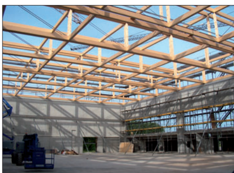
3-fach Sporthalle Frauenfeld