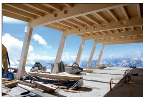
Berghaus Klein Matterhorn, Zermatt