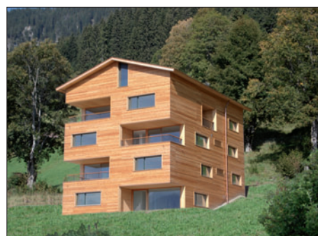
MFH Silberhorn Beatenberg